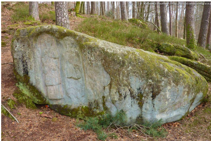
Rocher des Trois Figures

Wir folgen dem Weg mit der Markierung Rotes Dreieck und gehen geradeaus auf dem Forstweg. Nach einer Linkskurve biegen wir rechts auf den Pfad ab, der uns zum nahen Rocher des Trois Figures (3) führt.