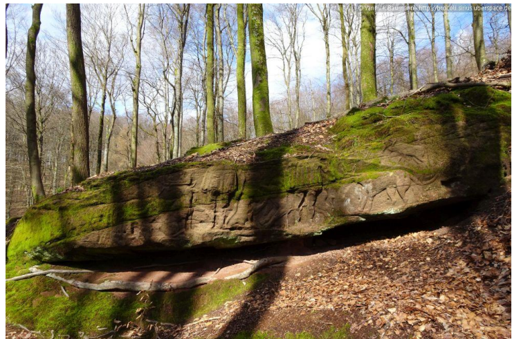
Felsrelief an der Source St-Hubert

ableitet, entspringt neben einem Felsen mit einem wunderschönen Felsrelief. Es sind die beiden Gottheiten Silvanus (Gott der Wälder) und Diana (Göttin der Jagd) bei einer gemeinsamen Jagd, ein Hund und Tiere des Waldes zu erkennen. Die beiden Gottheiten tragen eine Art Pumphose, was den seltsamen Namen der Quelle erklärt. Aufgrund der dargestellten Jagdszene wurde sie später nach dem Schutzpatron der Jagd, St. Hubert, benannt.